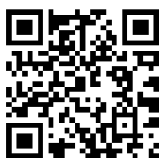
埼玉県介護福祉士会HP