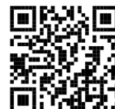
日本介護福祉士会HP